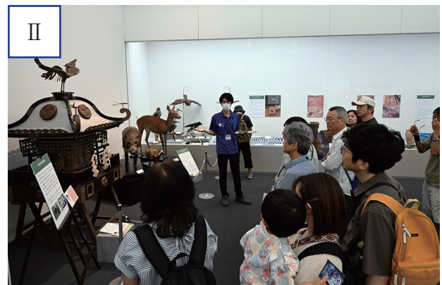
図3 関連イベント (1) 展示解説の様子 (7月21日(月) 実施回) I: 「(1) 博物館のこれまで」コーナーの解説 II: 「(2) 博物館の収蔵資料」コーナーの神輿の解説