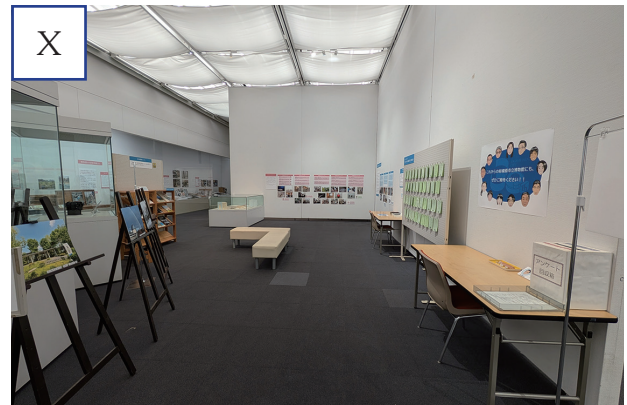
図2 会場の様子 I: 「(1) 博物館のこれまで」コーナーから展示導入部 II: 「(2) 博物館の収蔵資料」コーナー導入部 III: 「(2) 博物館の収蔵資料」コーナー民俗分野(左)と生物分野の一部(右) IV: 「(2) 博物館の収蔵資料」コーナー考古分野(手前)と地質分野の一部(奥) V: 「(2) 博物館の収蔵資料」コーナー天文分野 VI-VIII: 「(3) 博物館の役割」コーナー IX: 「(4) 博物館の今とこれから」コーナー X: 「(3) 博物館の役割」コーナーから「(4) 博物館の今とこれから」コーナー