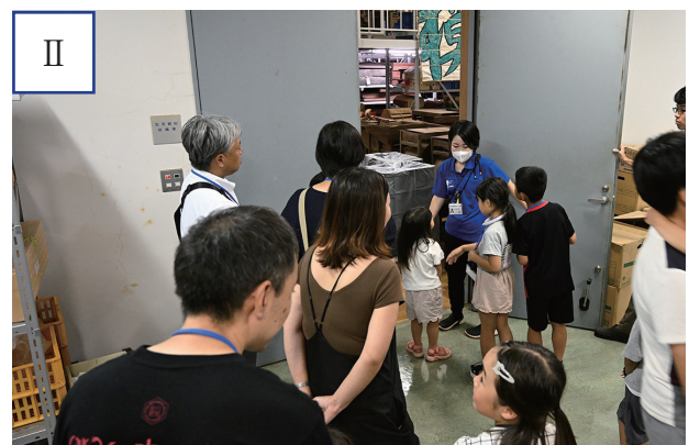
図4 関連イベント (2) 博物館バックヤードツアーの様子 I: 大型資料収蔵庫の見学 (8月2日(土) 実施回) II: 生活資料収蔵庫の見学 (8月15日(金) 実施回)