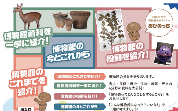
図 1 各コーナーレイアウト 「30 年の歩み」展チラシ裏面より抜粋

本企画展における展示資料一覧は後掲する表 1 のとおりで、総点数 115 件 503 点であった。