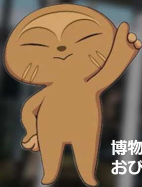
博物館キャラクター おびのっち

2025年11月20日に開館30年を迎えます！ 7月にプラネタリウムがリニューアルオープンします！