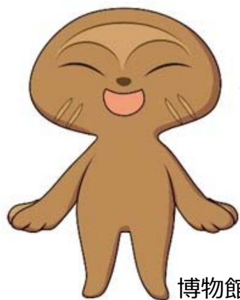
博物館キャラクター おびのっち

プラネタリウムはただいま 工事中。リニューアルオー プンは7月中旬を予定して いるよ！ 次にやってくる投影機 「ケイロンⅢ」は10億個の 星を映し出せるんだよ！