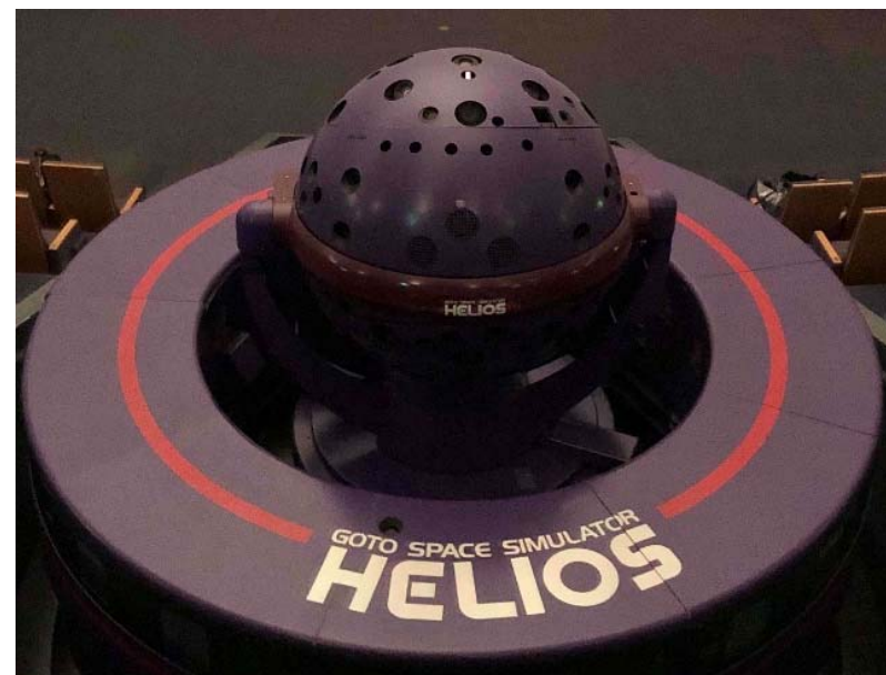
光学式投影機器「GSS-HELIOS (ヘリオス)」