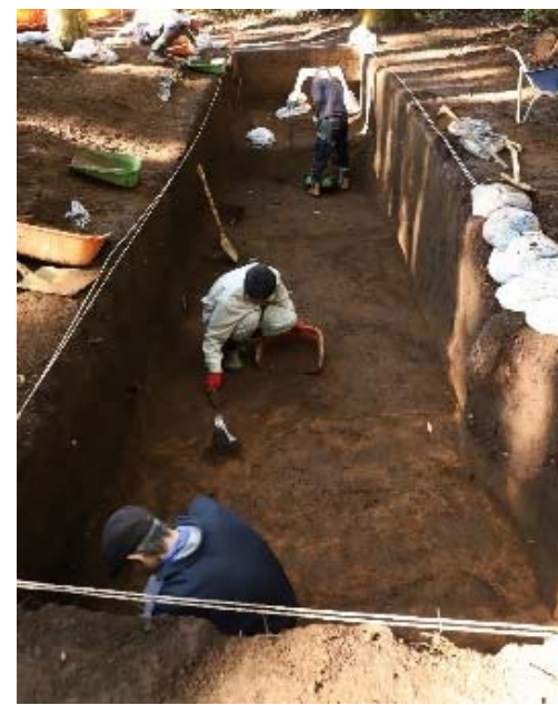
津久井城跡発掘調査のようす