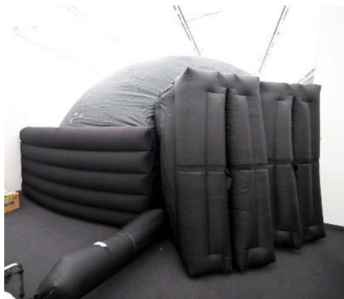
入口の様子(特別展示室)

ミニプラネタリウムは、空気で膨らませる布製の半球型エアドームスクリーンです。満天の星をお届けするほか、スクリーンいっぱい迫力ある全天周映画をお楽しみいただけます。