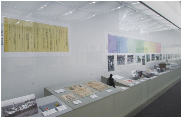
写真1 市制施行から70年間の出来事