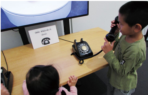
写真5 体験コーナー「黒電話にさわってみよう」