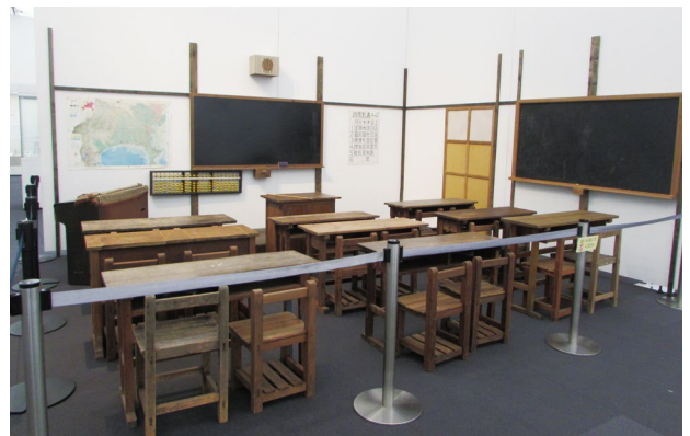
写真4 昭和20～30年代の教室を再現したジオラマ