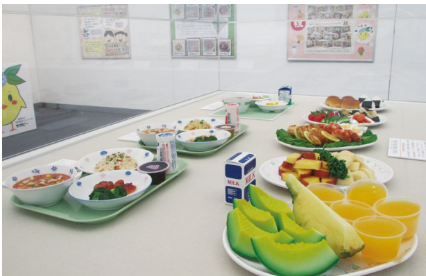
写真3 給食サンプル