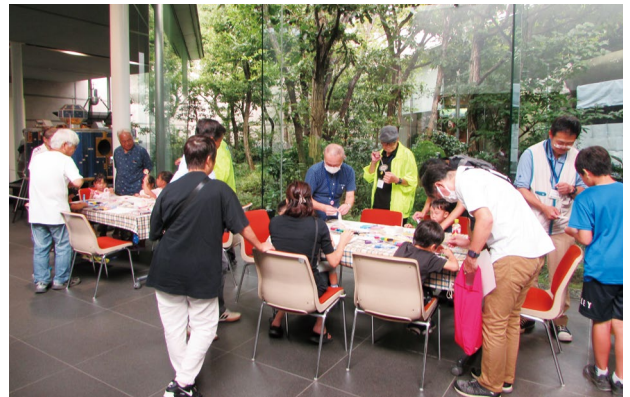
写真6 関連イベント「ぶんぶんゴマで遊ぼう！」