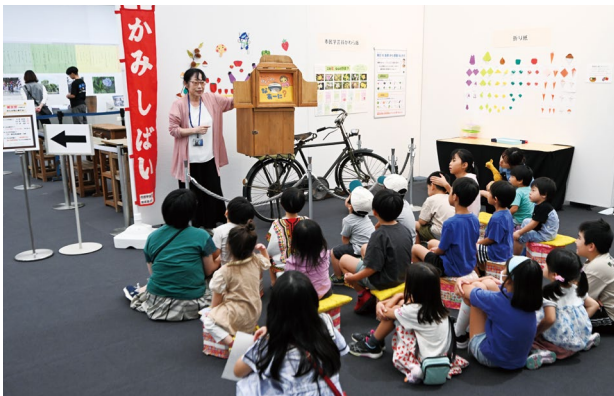
写真7 関連イベント「食育紙芝居」