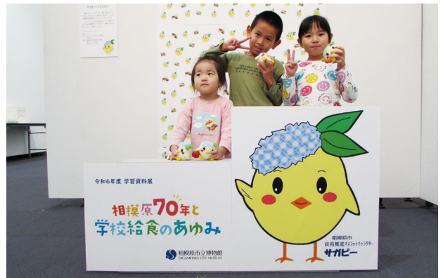
写真8 関連イベント「サガビー」のぬいぐるみとの記念撮影