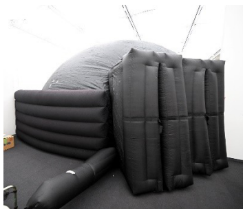
入口の様子(特別展示室)

ミニプラネタリウムは、空気で膨らませる布製の半球型エアドームスクリーンです。満天の星をお届けするほか、スクリーンいっぱい迫力ある全天周映画をお楽しみいただけます。