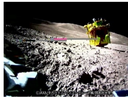
SORA-Qが撮影・送信した月面画像