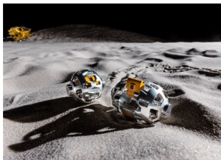
SORA-Q イメージ画像