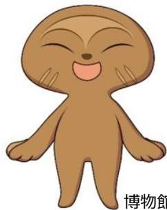
博物館キャラクター おびのっち

プラネタリウムはただいま 工事中。リニューアルオー プンは7月中旬を予定して いるよ！ 次にやってくる投影機 「ケイロンⅢ」は10億個の 星を映し出せるんだよ！