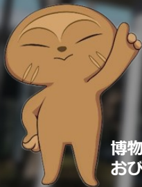
博物館キャラクター おびのっち

天文展示室と天文研究室は現在休室中、 プラネタリウムは休止中です。 特別展示室でミニプラネタリウムを上映しています。