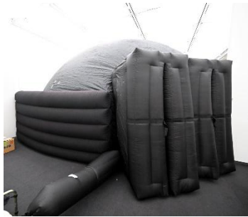
入口の様子(特別展示室)

ミニプラネタリウムは、空気で膨らませる布製の半球型エアドームスクリーンです。満天の星をお届けするほか、スクリーンいっぱい迫力ある全天周映画をお楽しみいただけます。