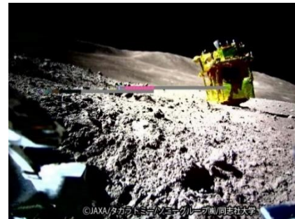
SORA-Qが撮影・送信した月面画像