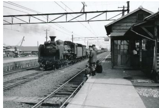
橋本駅に到着するSL牽引の貨物列車 昭和31(1956)年4月