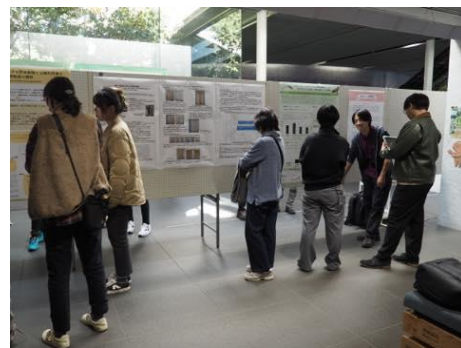
今年度の展示発表会の様子