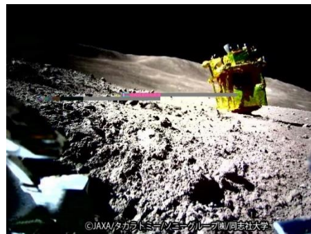
SORA-Qが撮影・送信した月面画像

プラネタリウム改修工事に伴い、11月19日(火)から天文展示室と天文研究室は休室しています。 天文展示室の展示物の一部については、12月3日(火)から6月29日(日)まで、特別展示室に展示します。