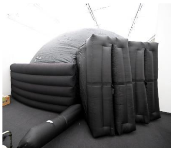
入口の様子(特別展示室)

ミニプラネタリウムは、空気で膨らませる布製の半球型エアドームスクリーンです。満天の星空のプラネタリウム、迫力満点の全天周映画を視界いっぱいの映像でお楽しみいただけます。