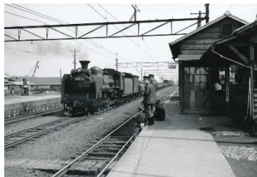
橋本駅に到着するSL牽引の貨物列車 昭和31(1956)年4月

博物館を拠点に活動するボランティアグループや、学芸員が活動に関わる学校の部活動、大学の研究室などが日ごろの活動・研究成果を発表する展示発表会です。