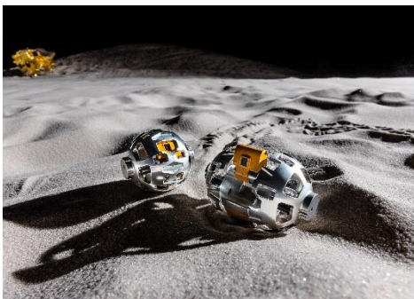
SORA-Q イメージ画像