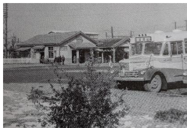
相模原駅前バスターミナル 昭和30(1955)年ごろ