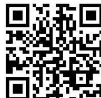
麻布大学 いのちの博物館HP