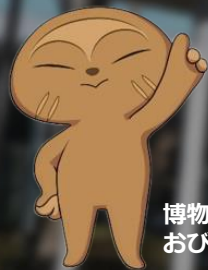
博物館キャラクター おびのっち

天文展示室と天文研究室は現在休室中、 12月3日(火)からプラネタリウムは休止となります。