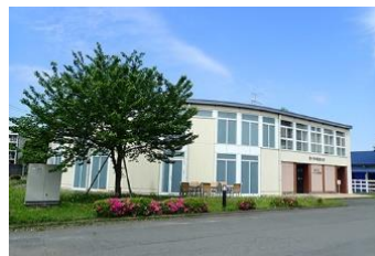
麻布大学いのちの博物館

【会場】 麻布大学いのちの博物館（相模原市中央区淵野辺1-17-71） ※入館は電話(☎042-850-2520)による 事前予約制 です。 開館日、開館時間は会場のスケジュールに準じます。 詳細は麻布大学いのちの博物館HPをご確認ください。