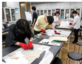
パネル制作の様子