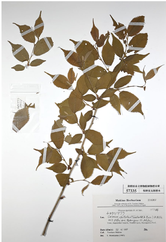
図5 チョウジザクラ (No.57335) 1937年 現在の相模原市緑区与瀬で採集