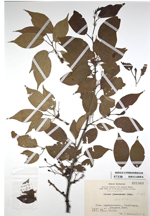
図6 ヤマザクラ (No.57338) 1937年 現在の相模原市緑区与瀬で採集