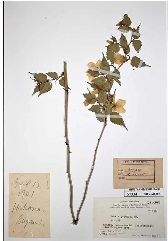
図4 ヤマブキ (No.57334) 1901年 箱根