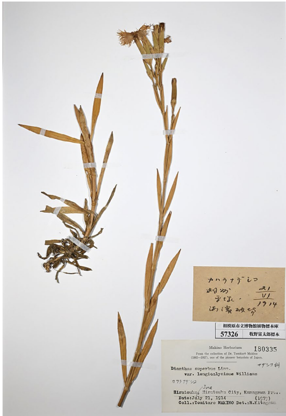
図3 カハラナデシコ (No.57326) 1914年 平塚