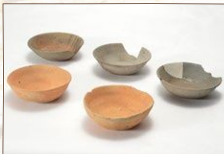
須恵器・土師器 (下森鹿島遺跡)