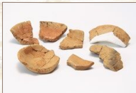
かわらけ (津久井城跡城坂曲輪群5号曲輪)