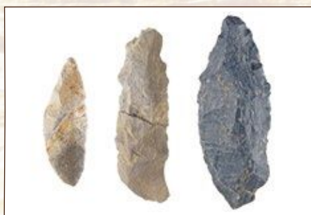
狩りの道具 (山王平遺跡)