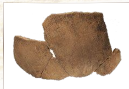
弥生土器 (川坂遺跡)