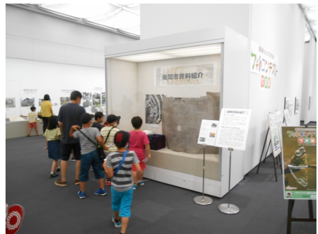
写真4 座間市資料紹介コーナー