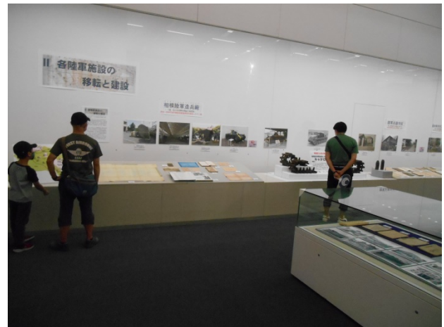
写真2 II章 各陸軍施設の移転と建設コーナー (前半)