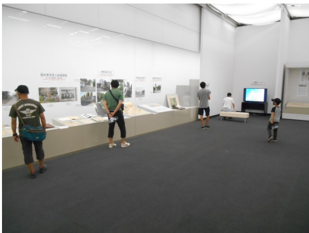
写真3 II章 (後半) と映像展示コーナー