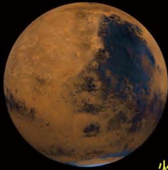
火星衛星探査計画 MMX