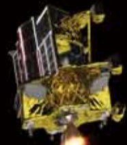
小型月着陸実証機 SLIM