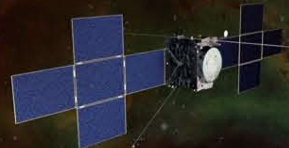
木星氷衛星探査計画 JUICE