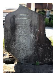
二十六夜月待供養塔（田名）