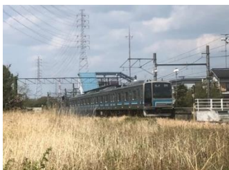
相模線の茅ヶ崎海岸への案内チラシ 相模線(相武台下駅)