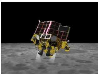
小型月着陸実証機「SLIM」