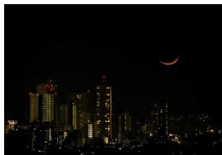
橋本の夜景と細い月

相模原市内で撮影した様々な月を紹介します。 また、月についての基本情報や天文現象のしくみについて展示します。