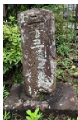
二十三夜月待供養塔（上溝）

十五夜の「月見」や二十三夜講等の「月待（つきまち）」など、相模原市域における月にまつわる文化や行事を紹介します。