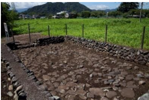
敷石住居跡(現地で露出展示しています)