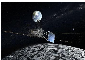
月周回衛星「かぐや」

JAXAが取り組む月探査関連の展示や、現在開発中の小型月着陸実証機「SLIM」実物大試験モデルの世界初公開など、これまでのミッションの科学成果や最新の探査技術を紹介します。