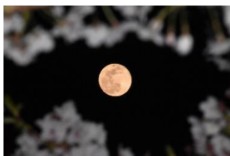
桜と満月（スーパームーン）