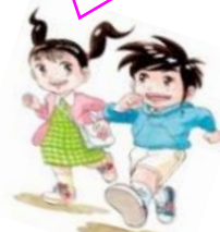
学習資料展キャラクター 大地さんと未来さん