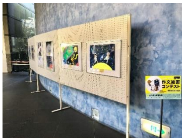
◀令和2年度 作品展の様子