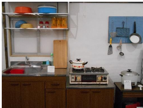
電化製品普及後の台所