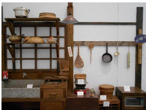
電化製品普及前の台所