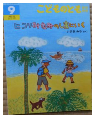
「ヒコリみなみのしまにいく」 いまきみち 作 (福音館書店)