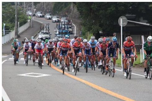
自転車ロードレース(荒丸会館付近)