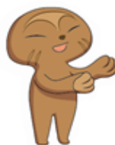
博物館キャラクター 「おびのっち」