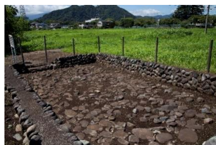
敷石住居跡(現地で露出展示しています)