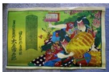
(吉野・大房豆腐店)の引き札

【期間】 7月25日(日)~8月28日(土) ※8月9日を除く、月曜日及び8月10日は休館