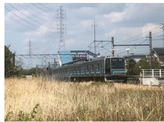
相模線(相武台下駅)