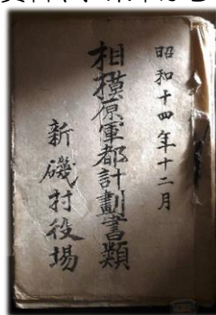
新磯村役場文書 「相模原軍都計画書類」