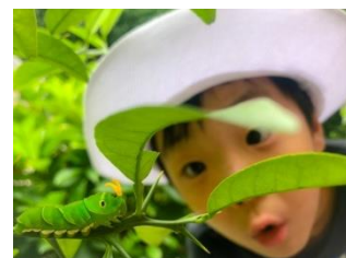
グランプリ作品 「きみもビックリ、ほくもビックリ」