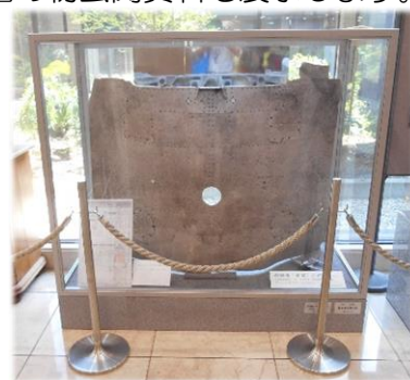
戦闘機「雷電」の部品 ※座間市から借用