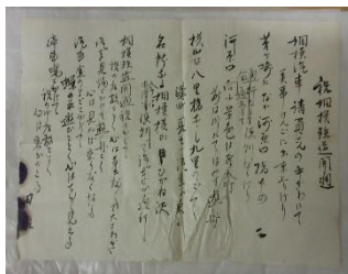
「祝相模鉄道開通」の歌の歌詞