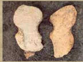
畑久保西遺跡の打製石斧出土状 況（神奈川県教育委員会所蔵）