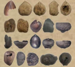
かさかいかせきあるかやとちてん 勝坂遺跡有鹿谷地点出土の 植物種実（当館所蔵）