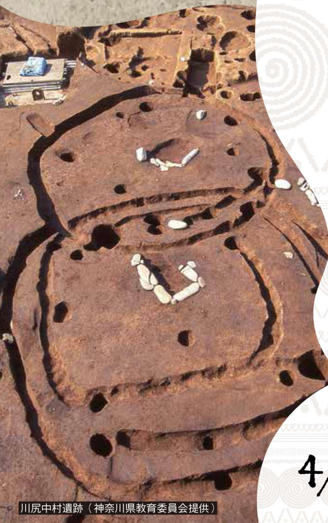
川尻中村遺跡