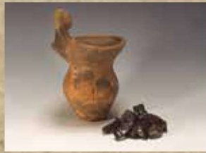
北原（No.9）遺跡出土の土器と 黒曜石（神奈川県教育委員会所蔵）