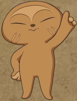
相模原市立博物館キャラクター おびのっち