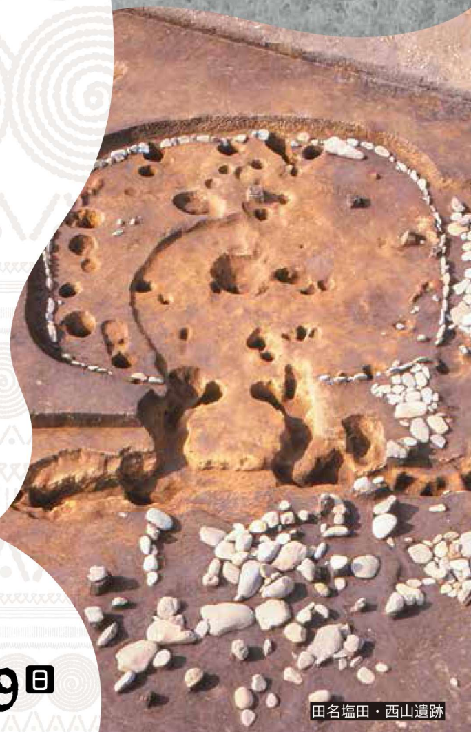
田名塩田・西山遺跡