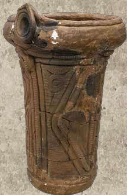
川尻遺跡出土の縄文中期の土器 (神奈川県教育委員会所蔵)