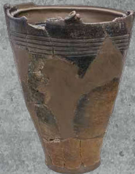
畑久保西遺跡出土の縄文後期の土器 (神奈川県教育委員会所蔵)