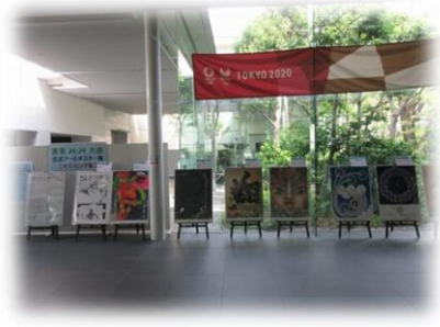
▲現在展示中のオリンピック版の様子