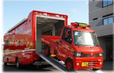
※この画像はイメージです。