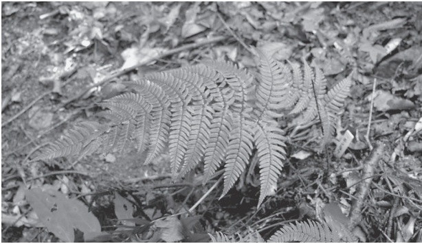
写真3 エンシュウベニシダ