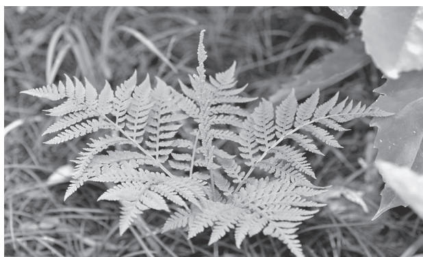
写真14 ナガボノナツノハナワラビ