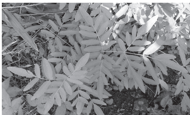
写真11 オオバヤシャゼンマイ