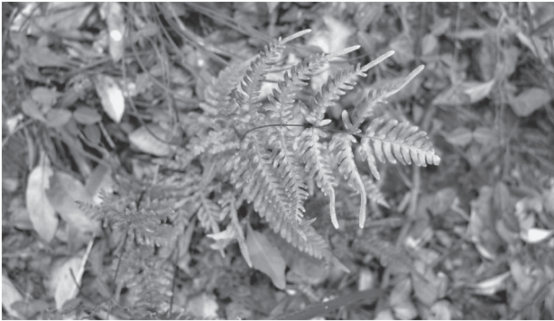
写真1 アマクサシダ