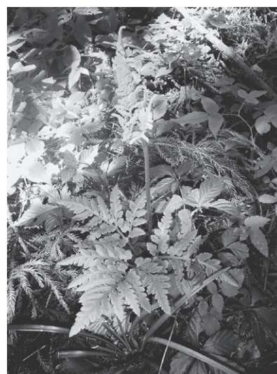
写真15 オオハナワラビ