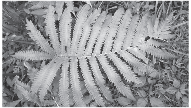
写真4 イヌガンソク