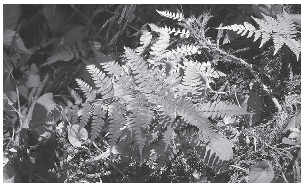
写真9 ヒロハイヌワラビ