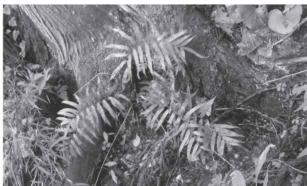
写真13 オオキジノシダ