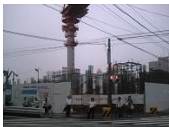
ほぼ同位置から撮影した、現在の駅の様子 （2006（平成18）年6月）

駅では現在、2008（平成20）年3月の全体工事完成を目指して、再開業が行われており、バスターミナルも移転、OXも仮設店舗での営業となっています。（参考：『小田急五十年史』（1980）小田急電鉄株式会社）