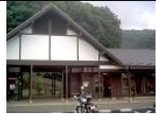
小原の郷(相模湖 町 小原) ちよう