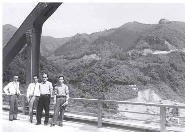
前の相模原市史の調査中、建設中の城山ダムにて向かって右端が筆者 1964（昭和39）年

歩いたことだけを書いてきました。津久井の歴史調査は、その自然の中を歩くことから始まるのです。歩いて古文書所蔵の旧家で古文書を拝見し、時には昼食ばかりか、夕食まで頂いたこともあり、その何軒かの方々とは今も交際させていただいています。自然と人と古文書、そして歩き回ったこと、これが私の津久井です。