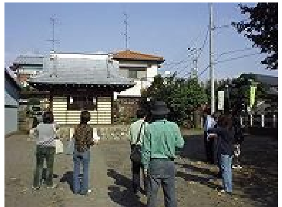
葛輪地区・金刀比羅神社にて

11月3日、民俗部会の部会員と調査補助員8名が参加し、巡検を実施しました。これは、前年から実施してきた麻溝・新磯地区に続き、田名地区の調査を始めるためのものです。当日は、田名八幡宮や南光寺などを巡り、田名地区の概略の把握に努めました。今後は、地域の方にお会いするなどして、伝承の聞き取り等を進めていきます。