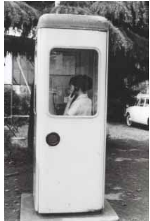
1968(昭和 43)年ごろ撮影

近年は携帯電話の普及で、公衆電話の利用も減っているようです。市史現代図録編所収の『電話加入数』の統計を見ると、1974(昭和 49)年に 3,038 台あった市内の公衆電話は、2001(平成 13)年には 2,379 台に減少しています。