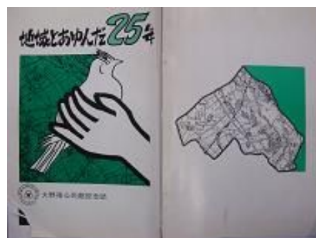
収集資料：大野南公民館の記念誌

情報を、ぜひ市史編さん室までお寄せください(連絡先は、4ページに記載)。より良い市史の刊行のために、皆様のご協力をお願いいたします。