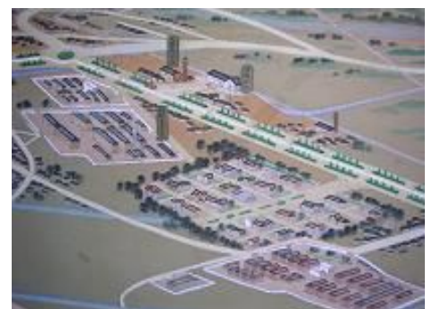
鳥瞰図 (部分) 相模大野駅北口周辺 小田急線の分岐部分や通称・行幸道路、現在のグリーンホール・相模女子大学・独立行政法人相模原病院付近が見える。