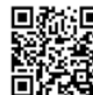
ネットで楽しむ博物館 (YouTube)