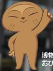
博物館キャラクター おびのっち

イベントの詳細は当館ホームページ・広報さがみはら等でご確認ください。 ※イベントは、変更・中止となる可能性があります。 次号は7月上旬発行予定です。