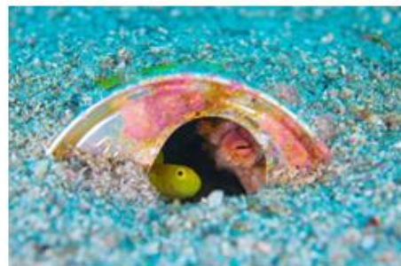
グラフィック賞「もう、入ってます」