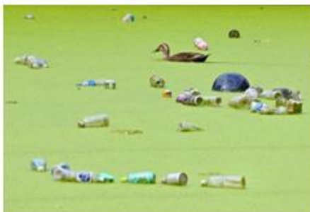
グランプリ「カモの困惑」