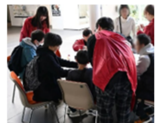
これまでの開催の様子 (星のストラップ作り)