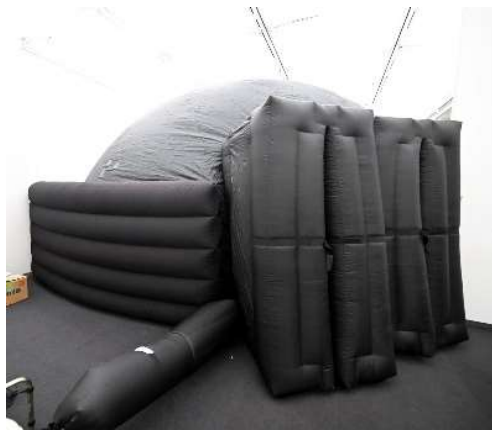
入口の様子(特別展示室)

ミニプラネタリウムは、空気で膨らませる布製の半球型エアドームスクリーンです。満天の星をお届けするほか、スクリーンいっぱい迫力ある全天周映画をお楽しみいただけます。