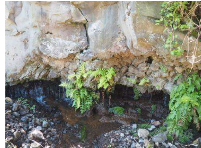
富士山の溶岩と湧水

【定員】 30名 ※事前申込制、抽選。当館HPの応募フォームからか、往復はがきに①参加者(1枚につき5名まで、代表者に○マーク)の氏名、年齢、電話番号、②返信用の宛名に住所・氏名を記入のうえ、当館宛てに郵送。HP、往復はがきともに4月15日(火)締切。