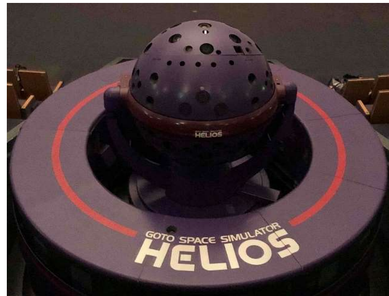
光学式投影機器「GSS-HELIOS (ヘリオス)」