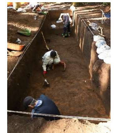
津久井城跡発掘調査のようす