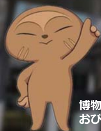
博物館キャラクター おびのっち

イベントの詳細は当館ホームページ・広報さがみはら等でご確認ください。 ※イベントは、変更・中止となる可能性があります。 次号は1月上旬発行予定です。