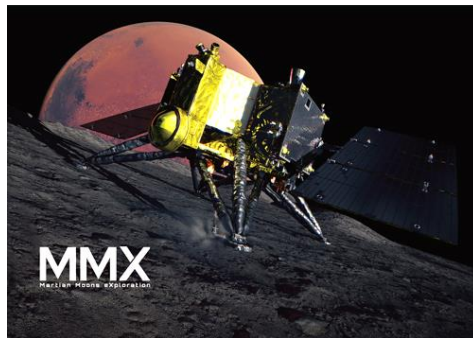
火星衛星探査計画MMX