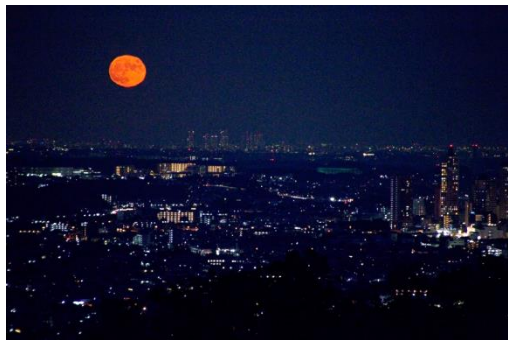
中秋の名月(相模原市緑区にて撮影)