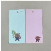
スペシャル短冊イメージ