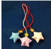
星のストラップイメージ